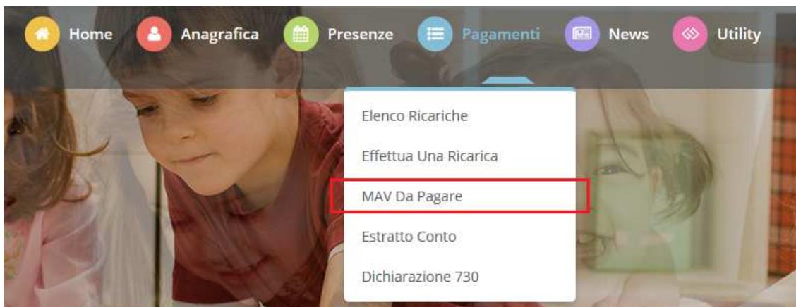
Figura 4 – Elenco MAV da Pagare

Si ricorda inoltre che il MAV, una volta effettuato il pagamento, sarà visualizzabile tra le vostre ricariche effettuate entro 24/48 ore.