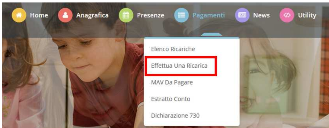
Figura 1 - Menu Pagamenti – Effettua una Ricarica

Selezionando la voce di menu, si aprirà un'altra pagina in cui si potrà scegliere l'importo da ricaricare tramite gli appositi talloncini o indicare un importo personalizzato