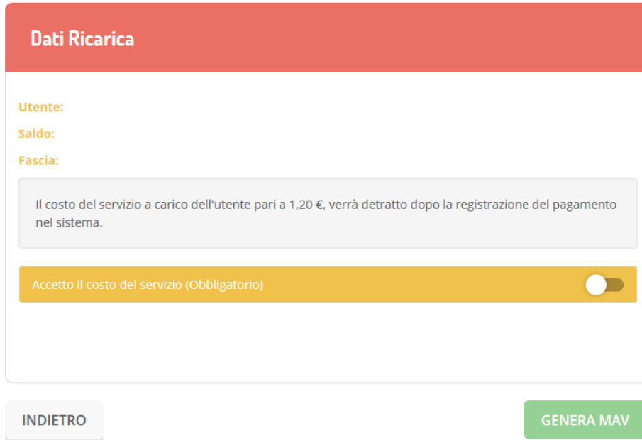
Figura 3 – Dati Ricarica